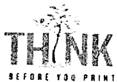
image007.jpg 3 KB