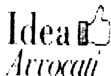
image006.jpg 2 KB