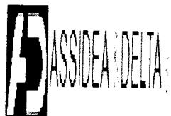
image001.png 2 KB