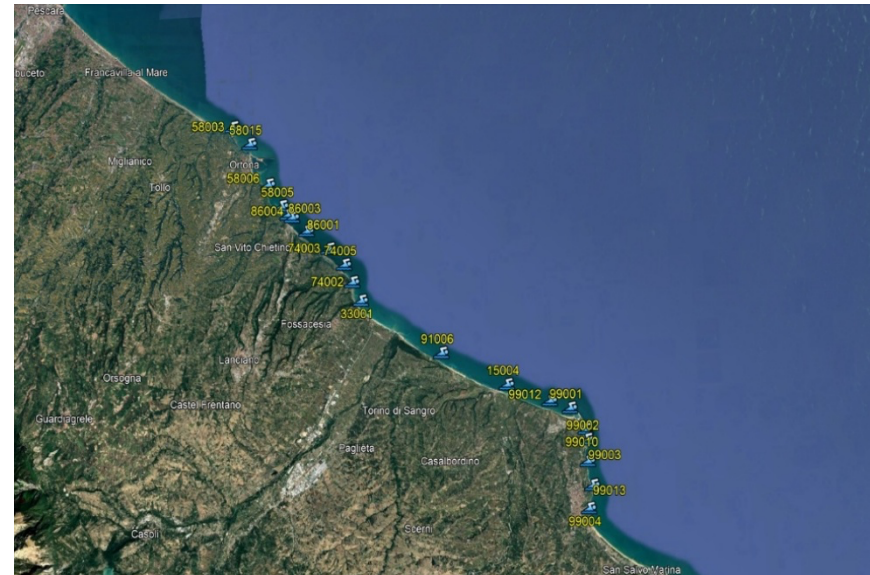
Mapa dei punti di prelievo della Ostreopsis ovata