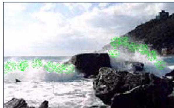
Esempio di biofilm marino e di aerosol prodotto con l'infrangersi delle onde sulla roccia