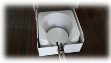
Filtro in fibra di vetro